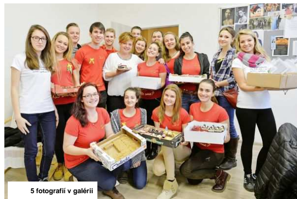
5 fotografií v galérii

Cieľom gymnázia je zužitkovať bilingválne skúsenosti a získaným certifikátom z čínštiny ponúknuť absolventom nezvyčajnú pridanú hodnotu. Najbližšia stredná škola takéhoto typu sa totiž nachádza až vo Francúzsku. „Bežné jazyky ako angličtina či nemčina sa vyučujú prakticky na každej škole, my sa snažíme byť progresívni. Veríme, že čínsky jazyk bude čoraz používanější aj v Európe a jeho znalosť prinesie veľmi zaujímavé možnosti na pracovnom trhu,“ predpokladá riaditeľka.