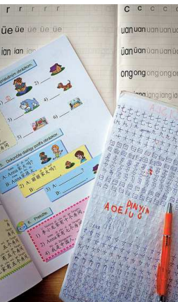
Ťažký jazyk: Na konci prvého ročníka by mali študenti poznať 600 slov a 617 znakov.