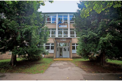
Gymnázium Mikuláša Kováča v Banskej Bystrici: S bilingválnym štúdiom čínštiny na strednej škole začínajú ako prví vo východnej Európe.